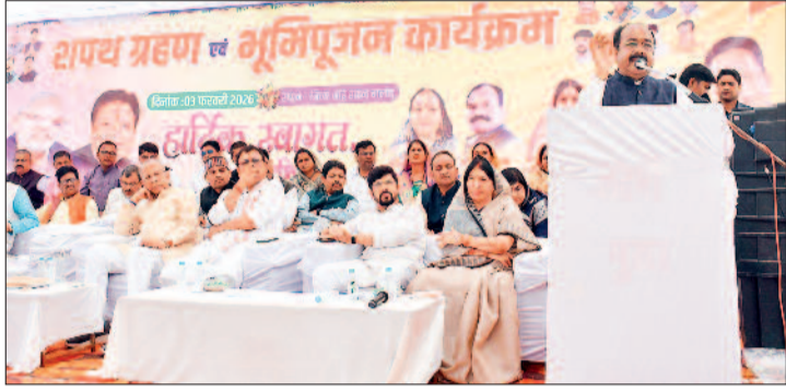
हरिभूमि न्यूज | बालोद

उन्होंने कहा कि साहू समाज के लोग अपने इस विशिष्ट उपलब्धियों एवं उच्च स्तरीय मानवीय गुणों के कारण प्रत्येक क्षेत्र में सम्मान अर्जित कर रहे हैं। साव जिला मुख्यालय बालोद के दल्लैरोड स्थित साहू सदन में आयोजित